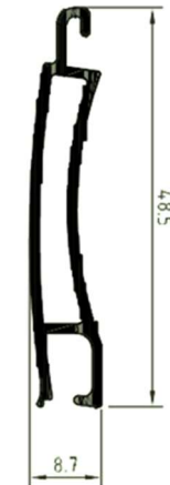
Lama ext. PS-40 60634