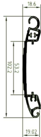
Lama seguridad 3000 monopared 60669