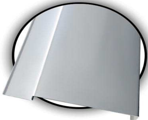
LAMA 84 LC/ 84LC PROFILE